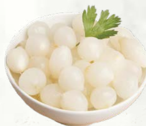
Srebrna čebulica 530 g