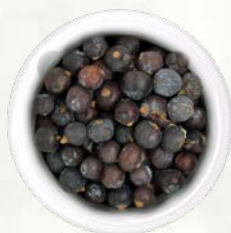
Brinove jagode v zrnju