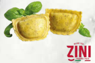
Ravioli Sorrisi z baziliko predkuhano zamrznjeno