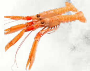
Škampi različnih velikosti zamrznjeno