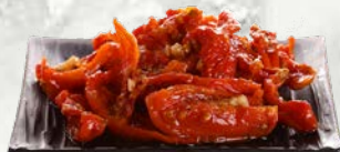
Sušeni paradižniki v sončničnem olju 1 kg