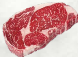
Goveji rib-eye steak pakirano v vakuumu 300 g sveže