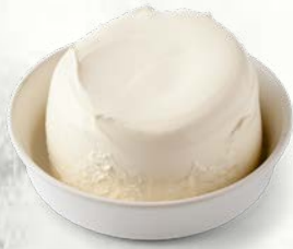
Mascarpone italijansko poreklo sveže