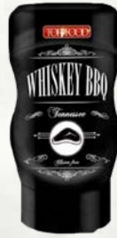
Omaka Whiskey Barbecue 320 g