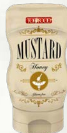
Gorčica z medom 285 g