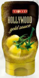
Omaka Hollywood Gold 300 g