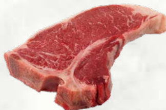
T-bone mlade govedine 600-700 ali 800-1000 g sveže