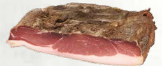
Polovica prekajenega specka italijansko poreklo