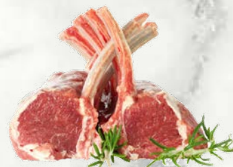
Jagnječja zarebrnica 600-800 g z 8 rebri razmerje kost:meso 75:35 zamrznjeno