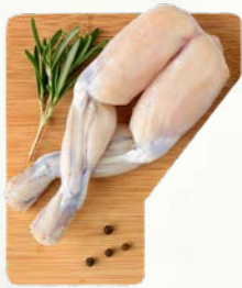
Žabji kraki zamrznjeno