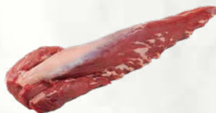
Pljučna mlade govedine brez verige 2,8 kg ali večja sveže