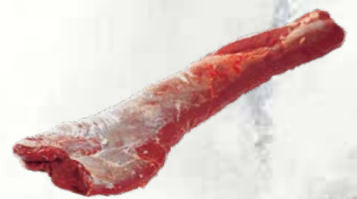
Jelenova ledja brez kosti zamrznjeno