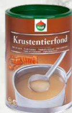
Škampova osnova Hugli 500 ml