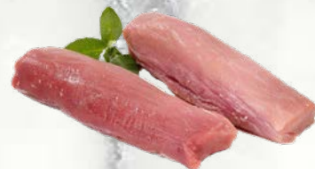
Svinjska ribica file pakirano v vakuumu sveže