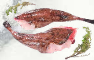
Repi grdobine (morske spake) 1-2 kg zamrznjeno