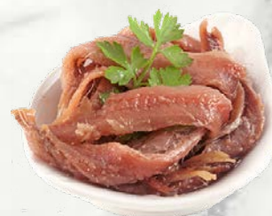
Slani fileti inčunov 680 g