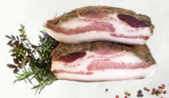
Guanciale - svinjske ličnice s poprom italijansko poreklo