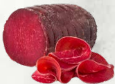
Polovica Bresaole italijansko poreklo