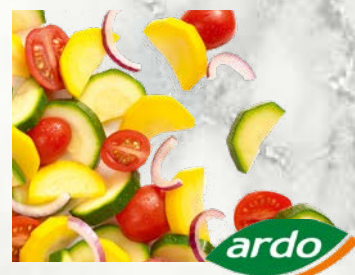
Bučke mix - Zucchini mix 2,5 kg zamrznjeno