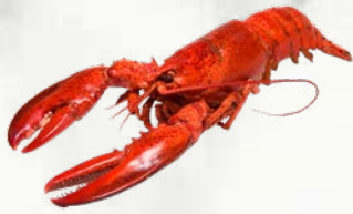
Jastog 0,4 do 1,7 kg sveže