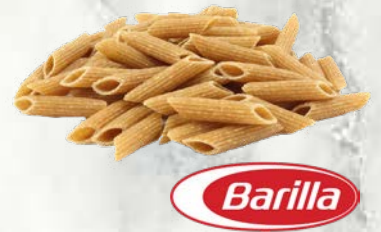
Polnozrnat peresniki - penne Barilla suho