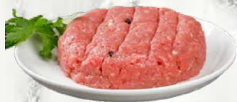
Tatarski biftek sveže