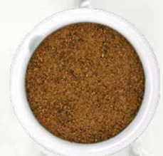
Muškatni orešček mleti