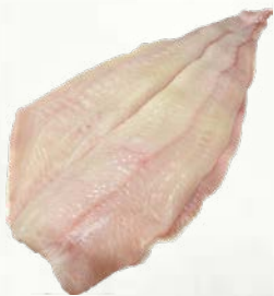
File platese (morske plošče) zamrznjeno