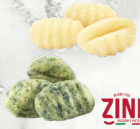
Krompirjevi njoki Krompirjevi njoki s špinačo zamrznjeno