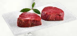
Medaljoni iz pljučne mlade govedine zamrznjeno