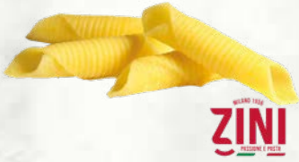
Italijanski fuži predkuhano zamrznjeno