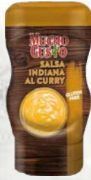
Karijeva omaka 290 g