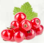
Rdeči ribez zamrznjeno