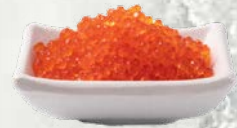
Rdeči in črni kaviar sveže