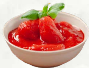
Pelati San Marzano 2,55 kg