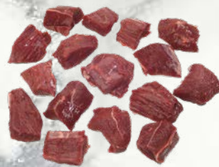
Jelenove kocke za golaž zamrznjeno