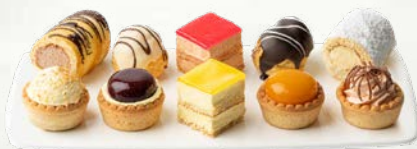
Minjoni različnih okusov zamrznjeno