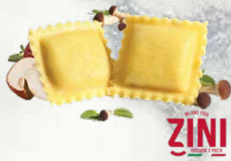
Ravioli z jurčki predkuhano zamrznjeno