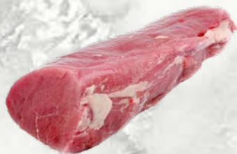
Telečji kare Rose brez kosti sveže