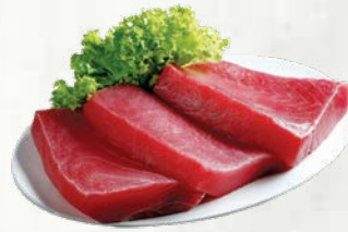
Rumenoplavuta rdeča tuna - srčni filon zamrznjeno