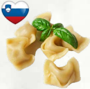
Idrijski žlikrofi Žlikrofi graham slovensko poreklo zamrznjeno