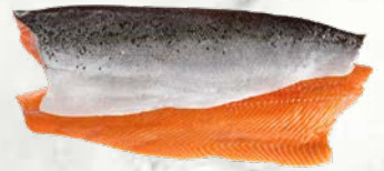
File atlantskega lososa trim D s kožo zamrznjeno