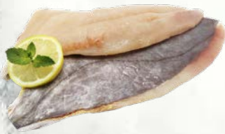
File kovača s kožo zamrznjeno