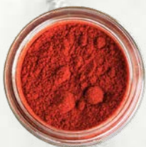
Sladka dimljena paprika mleta