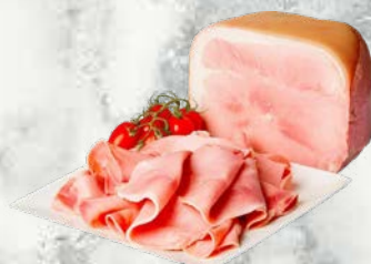
Kuhan pršut italijansko poreklo