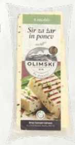
Beli Olimski sir z zelišči slovensko poreklo sveže