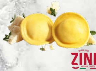
Ravioli Agnolotti s parmezanom predkuhano, zamrznjeno