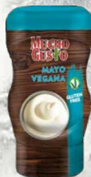
Veganska majoneza 260 g