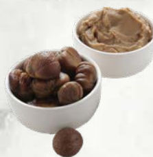
Naravni kostanjev pire 100 % kostanj zamrznjeno