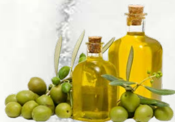
Ekstra deviško oljčno olje 1 L