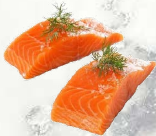
Divji losos v porcijah brez kože zamrznjeno