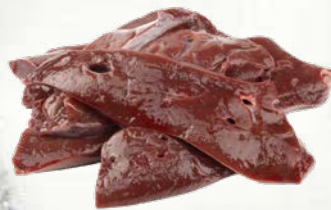
Telečja jetra reznana na laminat zamrznjeno