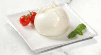
Bivolja mozzarella italijansko poreklo sveže