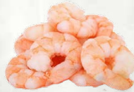
Oluščeni repki kozic Vannamei zamrznjeno