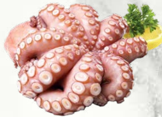
Kuhana hobotnica 0,7 do 1 kg zamrznjeno