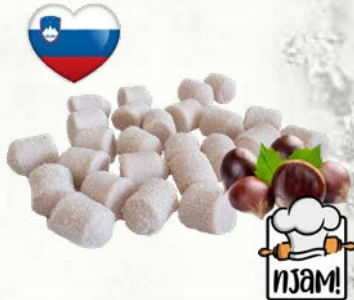
Domači njoki s skuto Domači kostanjevi njoki slovensko poreklo zamrznjeno