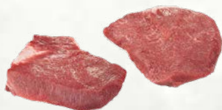
Telečje ličnice Rose 1,5 kg zamrznjeno