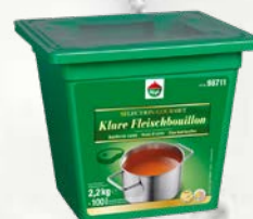
Goveja jušna osnova Hugli 500 ml