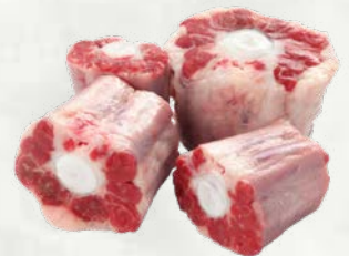
Repi mlade govedine sveže