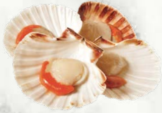
Polovice grebenastih pokrovač poreklo: Škotska zamrznjeno