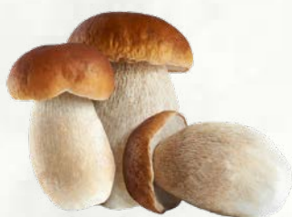
Celi gozdni jurčki 8 kg zamrznjeno