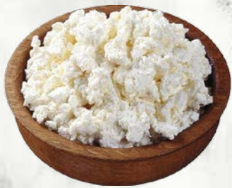
Domača skuta 40 % mlečne maščobe sveže