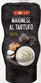
Majoneza s tartufi 265 g