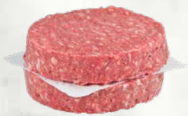
Burgerji iz govedine Black Angus sveže